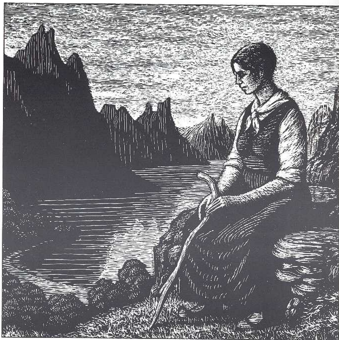
Gjeterjente. Scrapboard av Ingar Tangen

jenta. Ho ble redd og sprang til en stor stein og krabbet opp på den. Bjørnen etter og fikk tak i skjørtet og reiv det av henne. Det var festet med en hekte. Da skjørtet var borte, var det bare kroppen. Bjørnen ble stående å se på. Så ruslet den oppover bakken, så seg flere ganger tilbake, men lot til å være tilfreds med det.