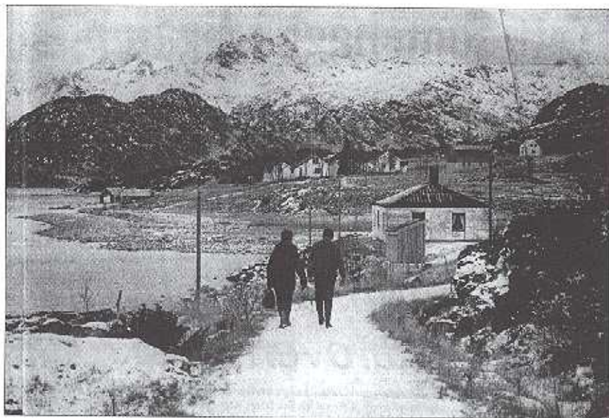
Gårdsveien fra kai.

Bygd på en reportasje fra «Harstad Tidende» 2. desember 1974 av Sevald Eilertsen.