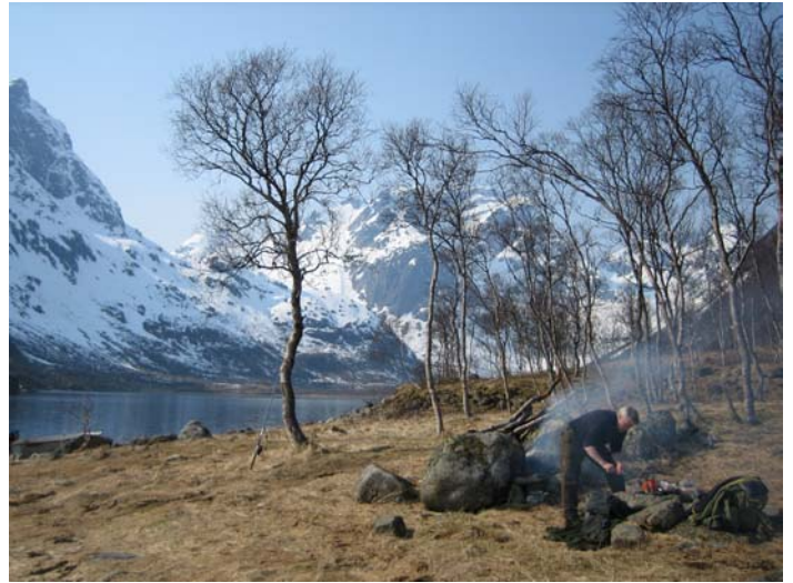
Vestpollen. Bålplassen ved Storelva

Dette første møtet med Husjord, fjorden og folkene der ble ikke det siste. Med unntak av 2-3 år, da huset på Volden var utleid i forbindelse med Husjordprosjektet, fra 1976 til 1978, har jeg vært der hvert år og ofte flere ganger i året. Og jeg kommer igjen - som tjelden – hver vår, gang på gang!