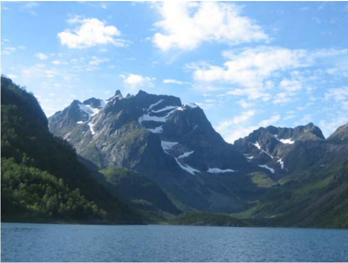
Vestpollen og Møysalen.