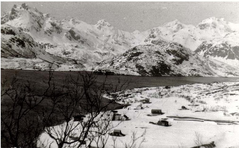
Husjord i vinterdrakt.