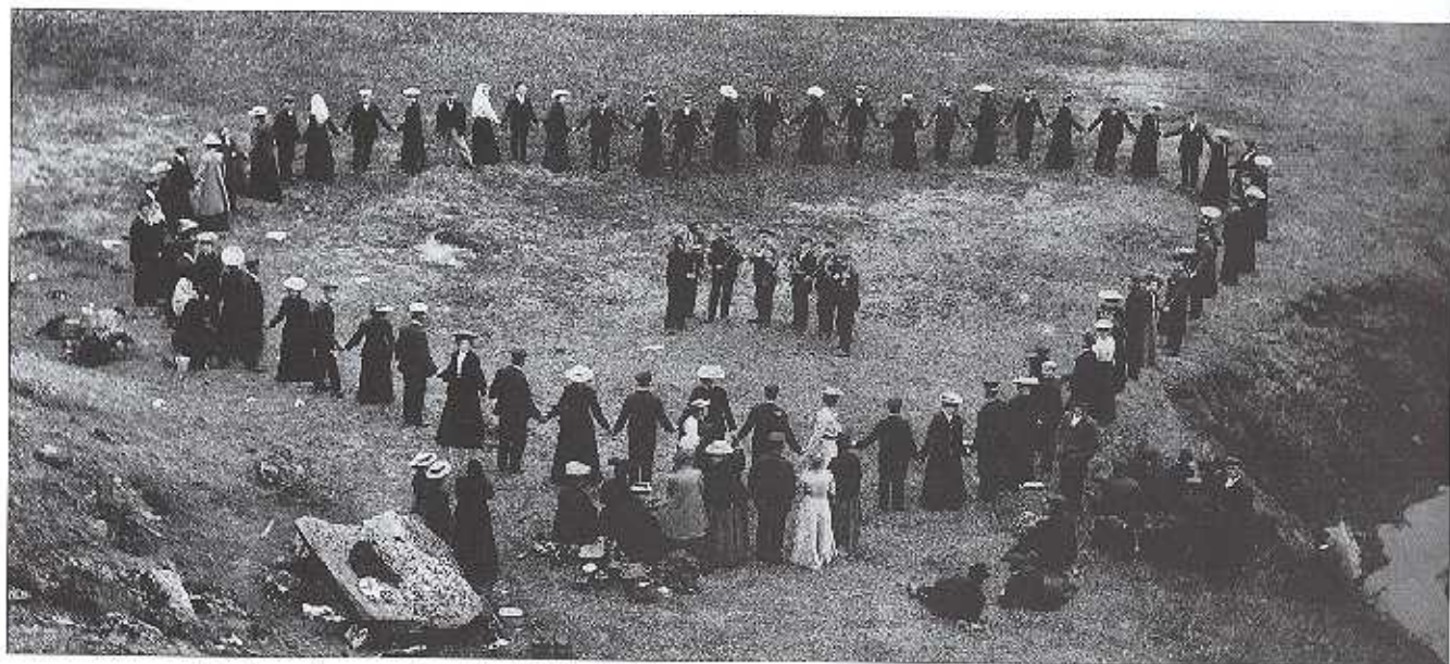
Ungdomsstevne Kvankjossfjelles 1906.

Særslag har laget ikkje havt mange av då det har mangla leidarar. Det einaste er spellag. Dette har spela skodespel ikkje berre i laget, men også i andre lag. Derimot er det gjort mykje for å gjeve ungdommen opplysning. Det har laget gjort ved foredrag, ordskiye, oplesning av blad og høker og av ein handskreven avis. Litteratur har det ikkje vore lett for ungdommen å få tak i. Laget har difor skaffa seg eit bibliotek. Laget har likevel ikkje berre gjort noko for ungdommen åndeleg sett, men også